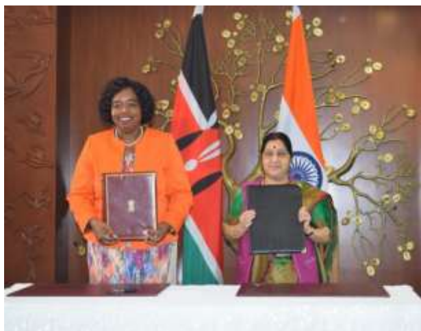
Η Υπουργός Εξωτερικών της Κένυας, Πρέσβυς κα Monica Juma , με την Ινδή ομόλογό της, κα Sushma Swaraj .

Η Υπουργός Εξωτερικών της Κένυας, Πρέσβυς κυρία Monica Juma , επισκέφθηκε επίσημα τον Μάρτιο 2019 την Ινδία όπου στο Νέο Δελχί είχε συνομιλίες με την Ινδή ομόλογό της, κυρία Sushma Swaraj . Οι συζητήσεις επικεντρώθηκαν στην ανάπτυξη συνεργασιών στους τομείς του πενταετούς αναπτυξιακού προγράμματος της Κένυας «The Big 4 Agenda» . Την Ινδία είχε ήδη επισκεφθεί επίσημα προ διετίας η Α.Ε. ο Πρόεδρος της Κένυας, κύριος Uhuru