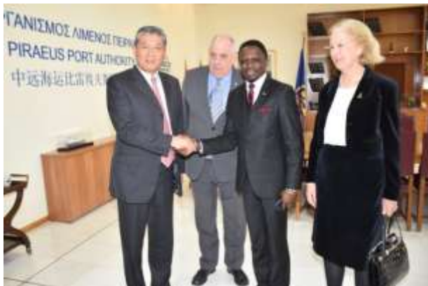
Από αριστερά προς τα δεξιά: Ο Αναπληρωτής Διευθύνων Σύμβουλος του Οργανισμού Λιμένος Πειραιώς Α.Ε., Captain Weng Lin, ο Υφυπουργός Εξωτερικών της Ελλάδας, κος Τέρενς-Νικόλαος Κουίκ, ο Υφυπουργός Εξωτερικών της Κένυας, κος Ababu Namwamba, και η Πρόξενος ε.τ. της Κένυας στην Ελλάδα, κα Βίκυ Πανταζοπούλου, στα κεντρικά γραφεία του ΟΛΠ. Ο ΟΛΠ Α.Ε. είναι μέλος του Ελληνο-Κενυατικού Επιμελητηρίου.