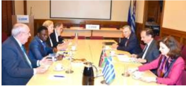
Ο Υφυπουργός Εξωτερικών της Κένυας, κος Ababu Namwamba, είχε συνάντηση με μέλη της Διοίκησης του Συνδέσμου Επιχειρήσεων & Βιομηχανιών, στα γραφεία του ΣΕΒ.