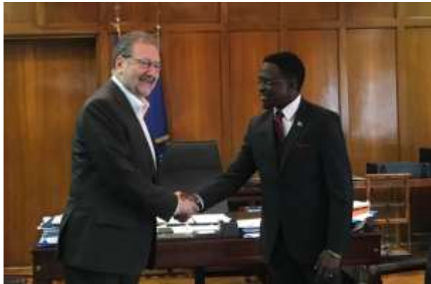
Ο Υφυπουργός Εξωτερικών της Κένυας, κος Ababu Namwamba, κατά τη συνάντησή του με τον Υφυπουργό Εξωτερικών της Ελλάδας, Αναπληρωτή Υπουργό Οικονομίας και Ανάπτυξης, κο Στέργιο Πιτσιόρλα, στο Υπουργείο Οικονομίας & Ανάπτυξης.