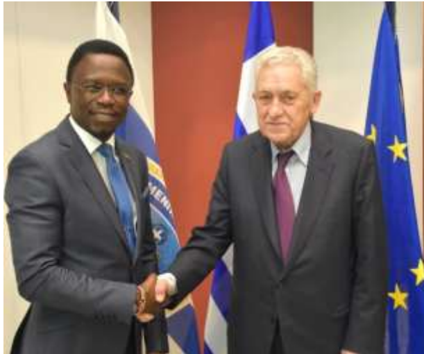
Ο Υφυπουργός Εξωτερικών της Κένυας, κος Ababu Namwamba, κατά τη συνάντησή του με τον Υπουργό Ναυτιλίας & Νησιωτικής Πολιτικής της Ελλάδας, κο Φώτη Κουβέλη, στο Υπουργείο Ναυτιλίας & Νησιωτικής Πολιτικής.