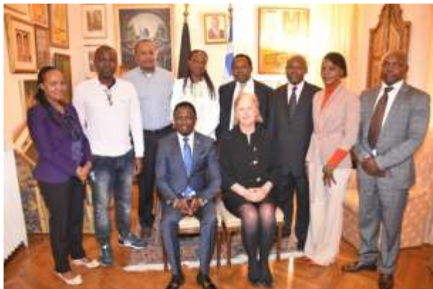
Ο Υφυπουργός Εξωτερικών της Κένυας, κος Ababu Namwamba, με μέλη του Δ.Σ. της Κοινότητας Κενυατών και την Πρόξενο ε.τ. της Κένυας στην Ελλάδα, κα Βίκυ Πανταζοπούλου, στο Προξενείο της Κένυας.