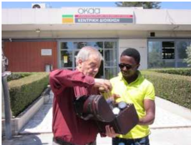
Ο Πρόεδρος του Δ.Σ. του Οργανισμού Κεντρικών Αγορών & Αλιείας ΑΕ, κος Μιχαήλ Μυτιληνάκης, παραδίδει αναμνηστικά δώρα στον Υφυπουργό Εξωτερικών της Κένυας, κo Ababu Namwamba.