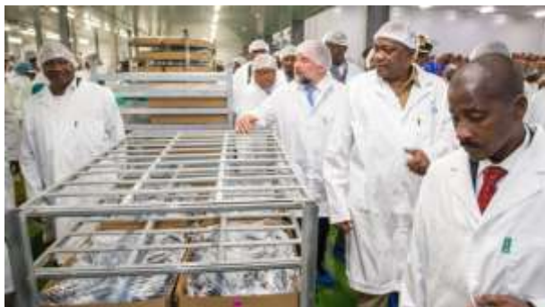
Η Α.Ε. ο Πρόεδρος της Κένυας, κος Uhuru Kenyatta, στο μεγαλύτερο εργοστάσιο κατάψυξης ψαριών σε όλη την Αφρική.

Κατά την τετραήμερη επίσημη επίσκεψή του τον Μάρτιο του 2019 στην Ναμίμπια, η Α.Ε. ο Πρόεδρος της Κένυας, κύριος Uhuru Kenyatta , ξεναγήθηκε και στις εγκαταστάσεις του μεγαλύτερου εργοστασίου κατάψυξης ψαριών σε όλη την Αφρική που βρίσκεται στον κόλπο Walvis. Το εργοστάσιο δημιουργήθηκε πρόσφατα με κόστος 40 εκατομμύρια δολάρια ΗΠΑ ως καρπός εταιρικής σχέσης μεταξύ της κυβέρνησης της Ναμίμπια και ενός ιδιώτη επενδυτή. Καταψύχει 600 τόνους ψαριών σε καθημερινή βάση και έχει δημιουργήσει θέσεις εργασίας για 700 άτομα.