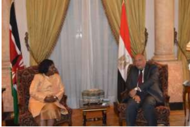
Η Υπουργός Εξωτερικών της Κένυας, Πρέσβυς κα Monica Juma με τον Αιγύπτιο ομόλογό της, κο Shoukry Sameh.

Κεντρικά ζητήματα των παραγωγικών διμερών συναντήσεων ήταν η ενίσχυση του εμπορίου και των επενδύσεων μεταξύ των δύο χωρών , η περιφερειακή και διεθνής ασφάλεια καθώς και ο ρόλος της Αιγύπτου που προεδρεύει της Αφρικανικής Ένωσης. Τα δύο μέρη επιβεβαίωσαν την ισχυρή τους δέσμευση να οδηγήσουν τις σχέσεις μεταξύ Κένυας και Αιγύπτου σε μεγαλύτερα ύψη.