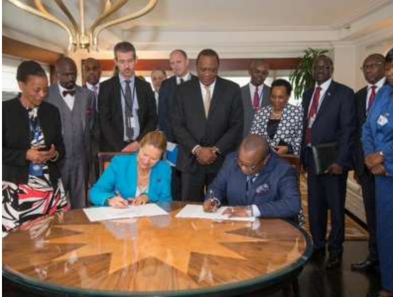
Στιγμιότυπο από την υπογραφή της συμφωνίας Κένυας - Ηνωμένων Εθνών.

Ενώπιον της Α.Ε του Προέδρου της Κένυας, κυρίου Uhuru Kenyatta , υπεγράφη τη 12 η Οκτωβρίου 2018 στο περιθώριο της 73ης Γενικής Συνέλευσης των Ηνωμένων Εθνών στη Νέα Υόρκη, μία συμφωνία για την παράδοση 100.000 προσιτών κατοικιών , έργο το οποίο θα χρηματοδοτηθεί μέσω της υφιστάμενης ήδη εταιρικής σχέσης μεταξύ της Κυβέρνησης της Κένυας και ειδικής υπηρεσίας των Ηνωμένων Εθνών (UNOPS) . Η συμφωνία υπογραμμίζει τη δέσμευση των Ηνωμένων Εθνών να προωθούν καινοτόμες χρηματοδοτήσεις που υπηρετούν τους Στόχους της Αειφόρου Ανάπτυξης. Οι συνολικές εκτιμώμενες επενδύσεις για το πρόγραμμα παροχής οικονομικά προσιτών κατοικιών είναι περίπου 13 δισεκατομμύρια δολάρια ΗΠΑ.