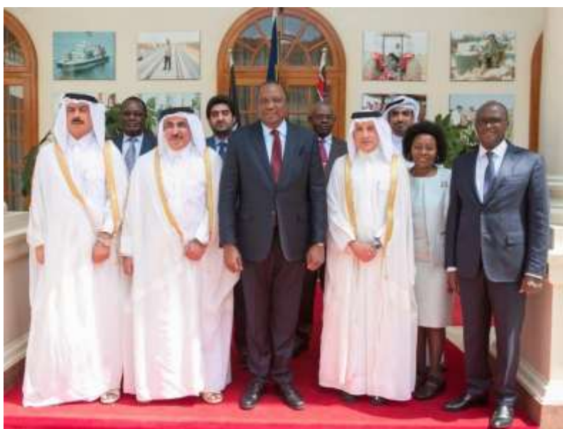
Η Α.Ε. ο Πρόεδρος της Κένυας, κος Uhuru Kenyatta, με υψηλά ιστάμενους αξιωματούχους του Κατάρ κατά την ανακοίνωση της Qatar Airways.

Σύμφωνα με επίσημη ανακοίνωση της Qatar Airways , η οποία δόθηκε στη δημοσιότητα τον