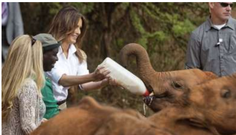
Η Πρώτη Κυρία των ΗΠΑ, Melania Trump, ταιΐζει μωρά ορφανά ελεφαντάκια στο πάρκο David Sheldrick Wildlife Trust.

Τον Οκτώβριο 2018 έφθασε στο Ναϊρόμπι η Πρώτη Κυρία των ΗΠΑ, Melania Trump , για μία επίσκεψη-ορόσημο προσκεκλημένη από την Πρώτη Κυρία της Κένυας, Margaret Kenyatta , ώστε να συνεχίσουν τις μεταξύ τους συνομιλίες οι οποίες ξεκίνησαν τον Αύγουστο 2018 κατά την επίσημη επίσκεψη στην Ουάσιγκτον της Α.Ε. του Προέδρου της χώρας, κυρίου