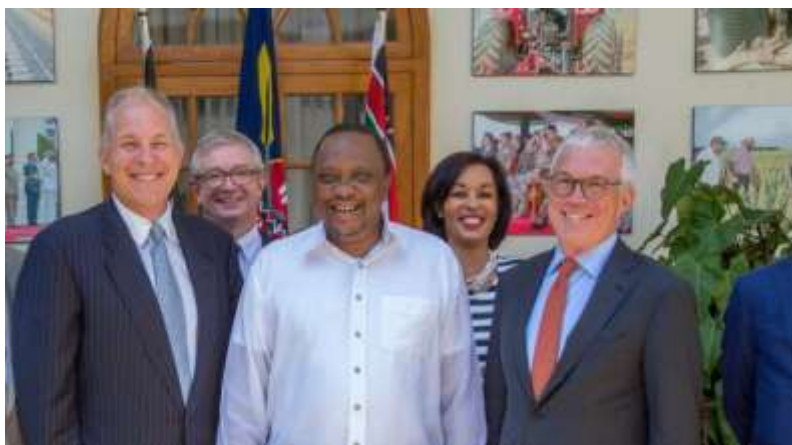
Η Α.Ε. ο Πρόεδρος της Κένυας, κος Uhuru Kenyatta, με τα κορυφαία στελέχη της General Electric Global.

συμπράξεις μεταξύ του δημοσίου και του ιδιωτικού τομέα, προκειμένου να ενισχύσει την αναπτυξιακή πορεία της χώρας.