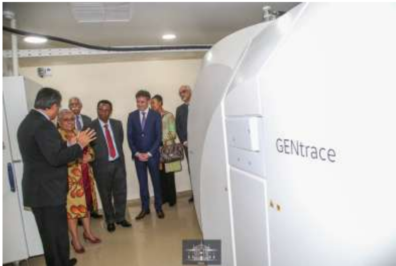
Η Πρώτη Κυρία της Κένυας, Margaret Kenyatta, κατά τα εγκαίνια της μονάδας.

πρώτο του είδους του στην Α. και Κ. Αφρική. Η εγκατάσταση του υπερσύγχρονου αυτού εξοπλισμού γίνεται στο πλαίσιο της προτεραιότητας για την υγεία προς όλους που δίνει η χώρα με βάση το πενταετές αναπτυξιακό της πρόγραμμα « The Big 4 Agenda ».