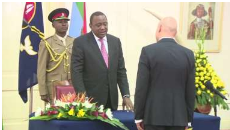
Η Α.Ε. ο Πρόεδρος της Κένυας, κος Uhuru Kenyatta, υποδέχεται τον Πρέσβη της Βραζιλίας, κο Fernando Coimbra.

Όπως δήλωσε ο νέος Πρέσβης της Βραζιλίας στην Κένυα, κύριος Fernando Coimbra , παρουσιάζοντας τα διαπιστευτήριά του στην Α.Ε. τον Πρόεδρο της χώρας, κύριο Uhuru Kenyatta , τον Μάρτιο 2018, η Βραζιλία είναι έτοιμη να προχωρήσει με γρήγορο βηματισμό στη συνεργασία της με την Κένυα στον τομέα της βαμβακοπαραγωγής . Επίσης, ενδιαφέρεται να προωθήσει την εμπορική και οικονομική συνεργασία μεταξύ τους μέσω επιχειρηματικών αποστολών καθώς και τη συνεργασία σε θέματα εκπαίδευσης .