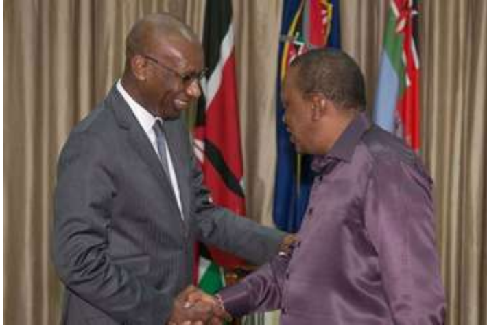
Η Α.Ε. ο Πρόεδρος της Κένυας, κος Uhuru Kenyatta, και το μέλος της Εκτελεστικής Επιτροπής της Total, κος Momar Nguer.

Η συμφωνία υπεγράφη μεταξύ της Α.Ε. του Προέδρου, κυρίου Uhuru Kenyatta , και του μέλους της Εκτελεστικής Επιτροπής της Total, κυρίου Momar Nguer . Ο συγκεκριμένος αγωγός αργού πετρελαίου στην Κένυα είναι ένας από τους δύο που διαθέτει ολόκληρη η ευρύτερη περιοχή της Ανατολικής Αφρικής . Η Total επανήλθε στο σχέδιό της για τον πετρελαιοαγωγό στην Κένυα, ύστερα από καθυστέρηση δύο ετών, κατά τα οποία διενήργησε ελέγχους για τις συνθήκες ασφάλειας στο βόρειο τμήμα της χώρας από το οποίο θα διέλθει ο αγωγός.