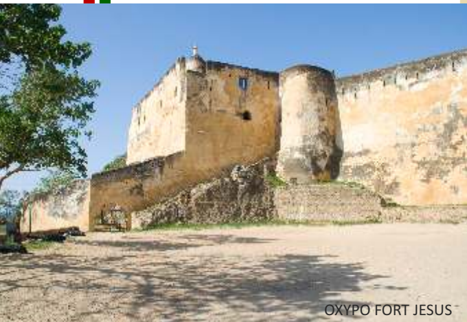
ΟΧΥΡΟ FORT JESUS

Συνεχίζουμε προς την περιοχή Γέντε (Gede) με τα απομεινάρια παλατιών, τζαμιών και αστικών σπιτιών , όλων κτισμένων από κοραλλιογενείς βράχους κατά το 13 έως και το 17ο αιώνα, που τώρα τα έχει σχεδόν κερδίσει η καταπράσινη αγκαλιά της ζούγκλας. Όπως έδειξαν οι ανασκαφές, η περιοχή είχε ένα μικτό πληθυσμό από Αραβικούς λαούς και γηγενείς λαούς Μπαντού. Παρόλο που κάποια από τα οικοδομήματα έχουν αναστηλωθεί, ο τόπος έχει έναν απόκοσμο και σχεδόν μυστηριακό χαρακτήρα και μας δίνει την ευκαιρία για πολλές ατμοσφαιρικές φωτογραφίες . Στο τοπικό μουσείο περιεργαζόμαστε καλλιτεχνουργήματα που έφεραν στο φως οι ερευνητές. Εκεί κοντά, παρακολουθούμε και τον παραδοσιακό χορό της φυλής Γκιριάμα (Giriama). !