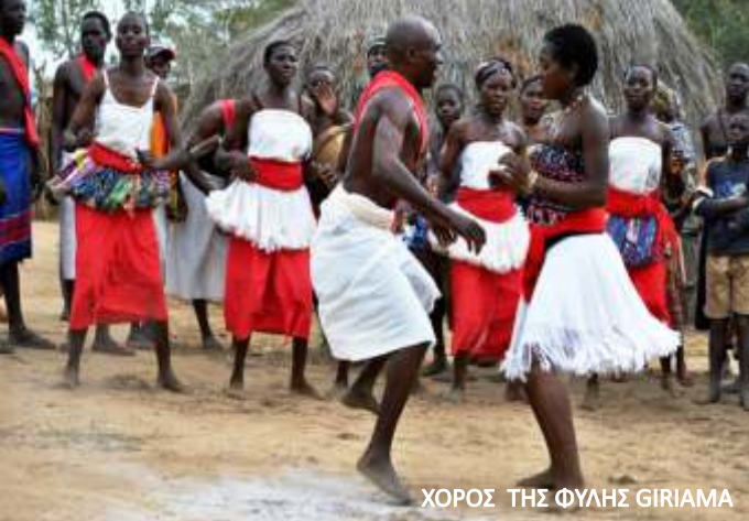
ΧΟΡΟΣ ΤΗΣ ΦΥΛΗΣ GIRIAMA

Στην επιστροφή για Μομπάσα περνάμε από το Εθνικό Πάρκο του παράκτιου τροπικού δάσους Αραμπούκο Σοκόκε (Arabuko Sokoke National Park) με την πολύ ενδιαφέρουσα χλωρίδα και πανίδα του όπου ξεχωρίζει ένα από τα πιο σπάνια είδη ζώων της χώρας , η ελεφαντομυγαλή ( Rhynchocyon chrysorygus ), ένα μικρό εντομοφάγο θηλαστικό.