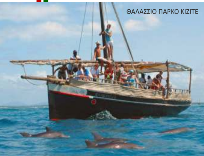
ΘΑΛΑΣΣΙΟ ΠΑΡΚΟ ΚΙΖΙΤΕ